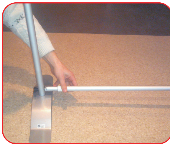
Prie kojos prisukite apatinį strypą. Iškelkite stovą iki reikiamo aukščio.