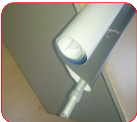
Įdėkite teleskopinius strypus į plakato kišenes.